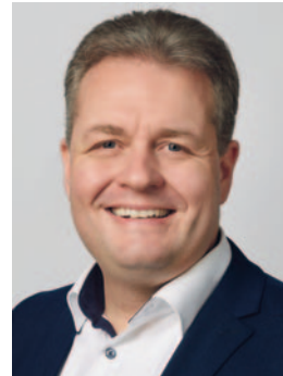
5. Gerrit Müller Bürgermeister, Rennerod